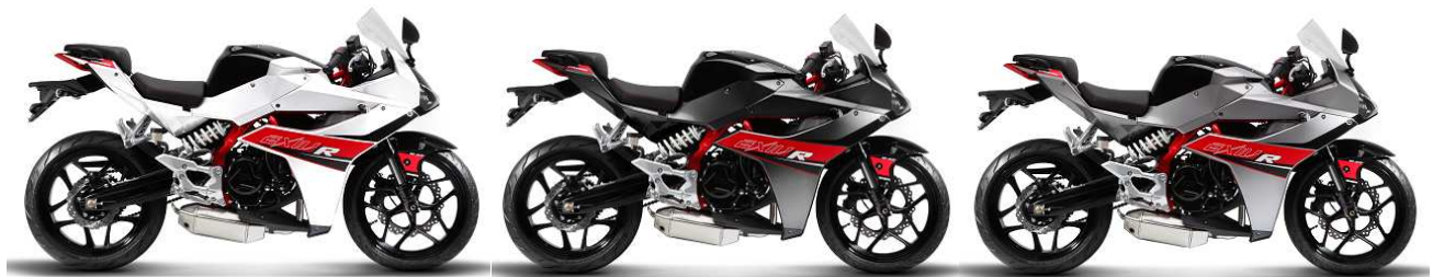
ホワイト/ブラック